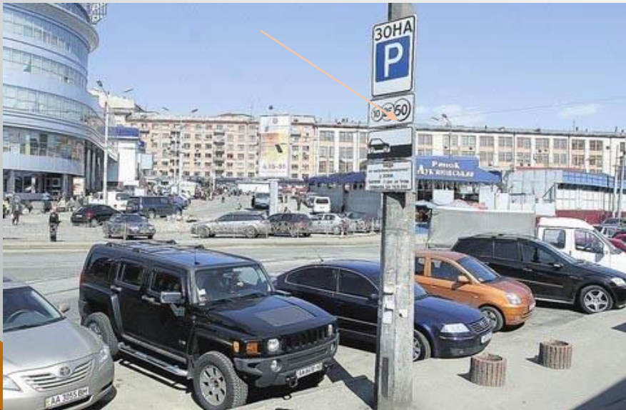
фото - 2)