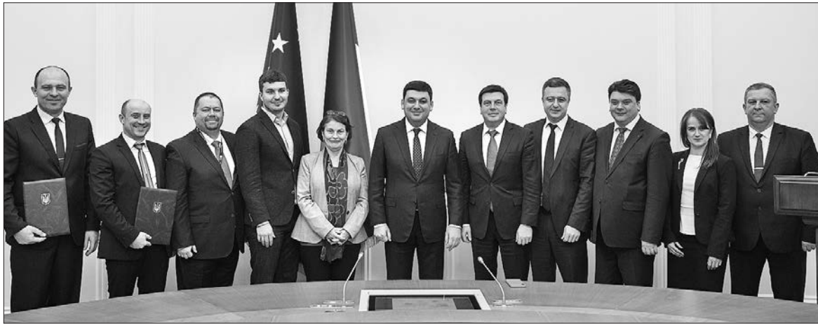
Дорослі обіцяють, що співпрацюватимуть з юними громадянами злагоджено, як пальці однієї руки

Глава представництва ЮНІСЕФ в Україні Джованна Барберіс зазначила, що ініціатива «Громада, дружня до дітей та молоді» не нова для України. «Але саме сьогодні є нагода більш ефективно реалізувати її за-