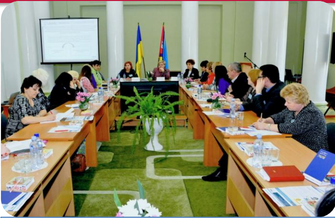
м. Первомайськ (березень 2017 року)

Асоціація міст України СПІЛЬНИМИ ЗУСИЛЛЯМИ