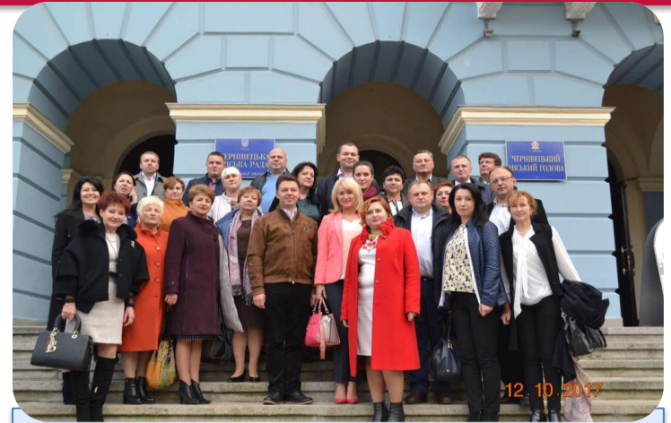
м. Чернівці (жовтень 2017 року)