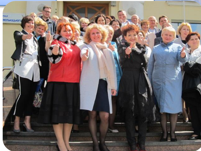
м. Луцьк (квітень 2018 року)