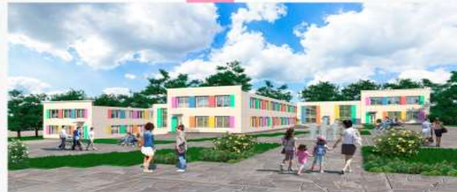
Кам'янська гімназія №13