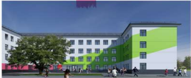
Нікопольська школа №19