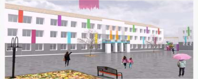
Дніпровська школа №9