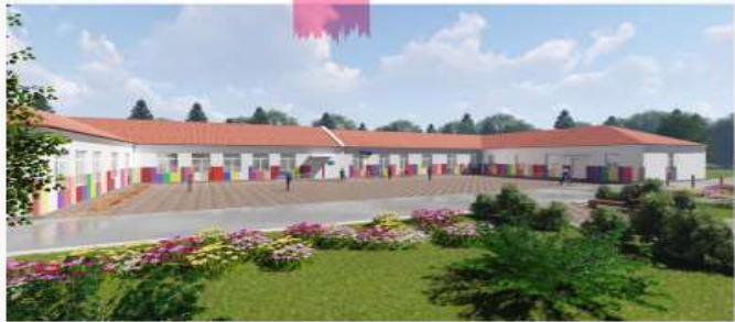
Петриківська початкова школа