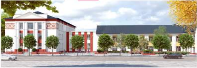
Кам'янська школа №6