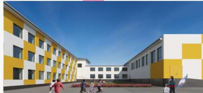
Покрівська школа №1