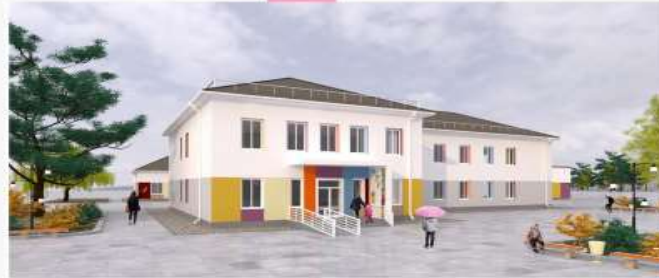
школа №2 в Межовій