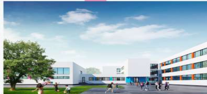
Марганецька школа №9