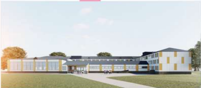
Магдалинівська опорна школа