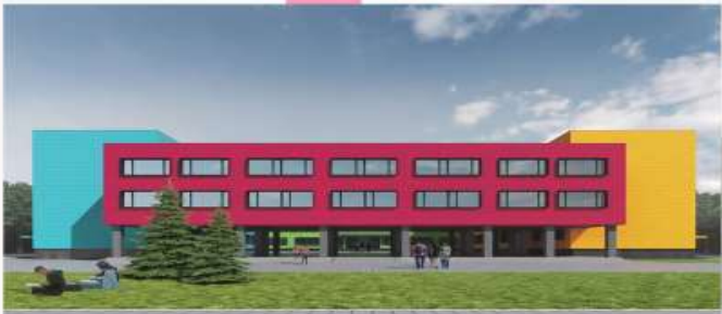
Школа у Жовтих Водах