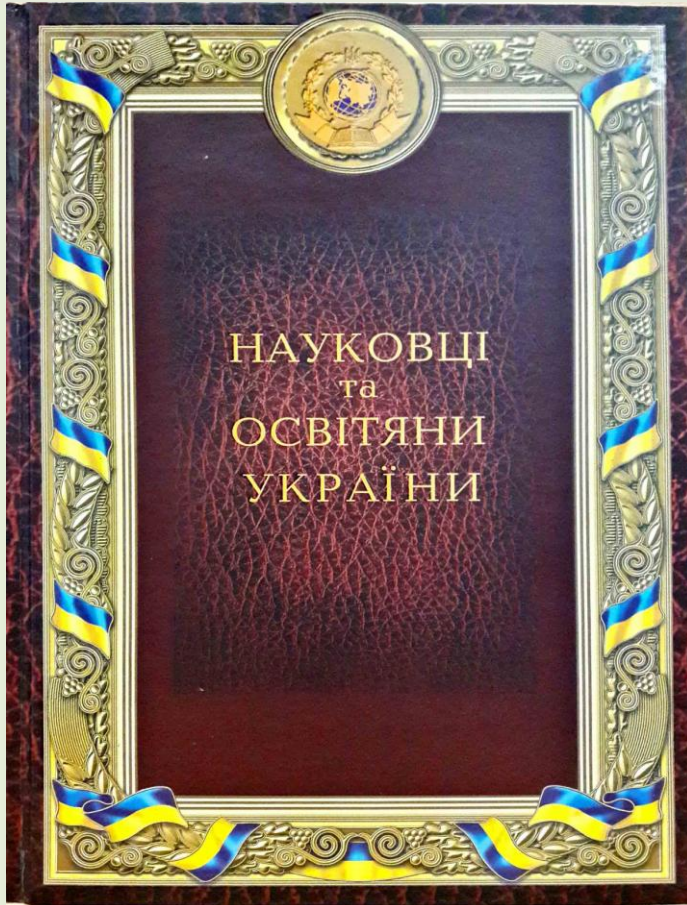
Науковці та освітяни України 2016