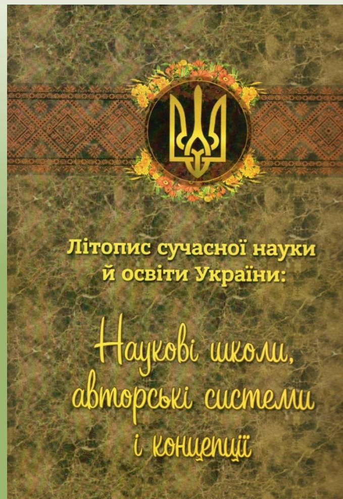
Літопис сучасної науки й освіти України (2013, 2014, 2016, 2018)