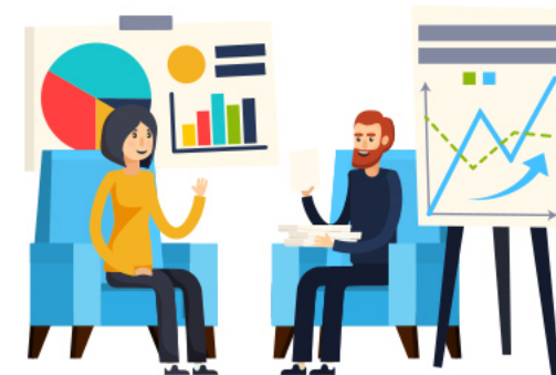
ПЛАТНИКИ ЄДИНОГО ПОДАТКУ 2 ГРУПИ