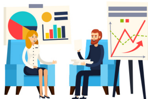
ПЛАТНИКИ ЄДИНОГО ПОДАТКУ І ГРУПИ