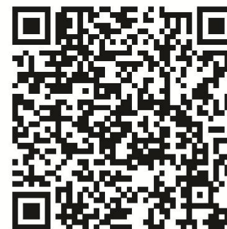
АМУ у facebook

Ця презентація була підготовлена за підтримки Європейського Союзу і його держав-членів Німеччини, Швеції, Польщі, Данії, Естонії та Словенії. Зміст цієї публікації / цього відео є виключною відповідальністю її / його авторів та не може жодним чином сприйматися як такий, що відображає погляди Програми «U-LEAD з Європою», уряду України, Європейського Союзу і його держав-членів Німеччини, Швеції, Польщі, Данії, Естонії та Словенії.