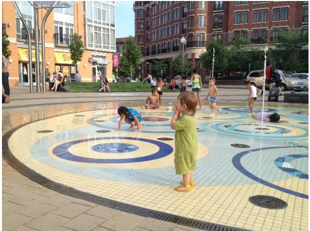
Рис. 2. Площа-фонтан в Каліфорнії (США)