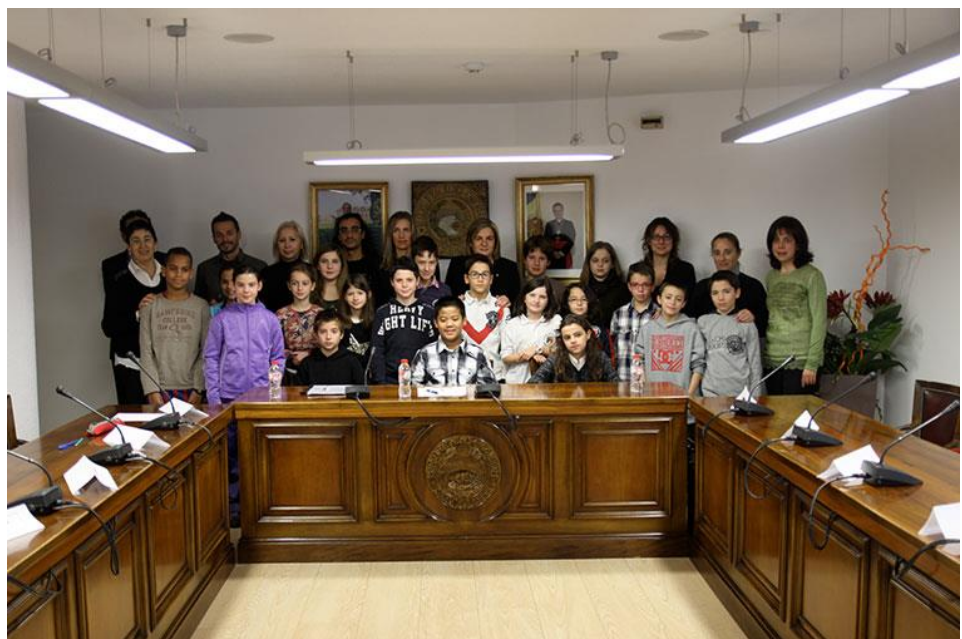
Рис.3. Дитячі слухання в Андорі

Бути почутим: наявність, відкритість та дієвість органів дитячого самоврядування на рівні шкіл, міста, дитячі дорадчі ради, дитячі зібрання та слухання (рис.3), дитячі громадські організації тощо.